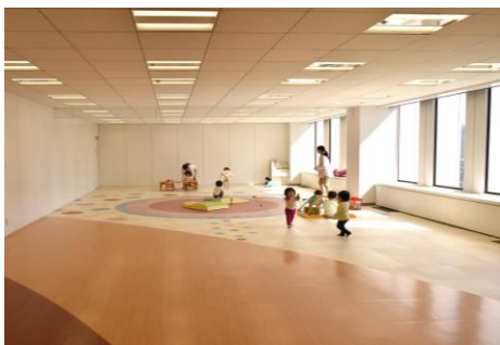
増床した「WithKids」スペース

2016年12月の「WithKids」開設以降、育児休業取得後1年未満での早期復帰や4月以外の月での復帰、時間指定勤務からフルタイム勤務への移行など、本人の望む働き方を選択できる環境が実現しています。従業員満足度の高まりや利用希望者の増加を受け、社員へのアンケート調査や社内の年齢別平均出産率などをもとに今後の需要予測を行い、このたび施設を拡大する運びとなりました。